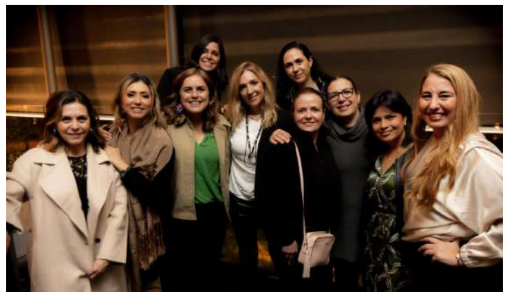
Miembros del Consejo Ejecutivo de la Alianza, Patrocinadores y Speakers de la III Cumbre en el Cocktail de apertura el 14 de Noviembre en el Hotel Brick, CDMX.